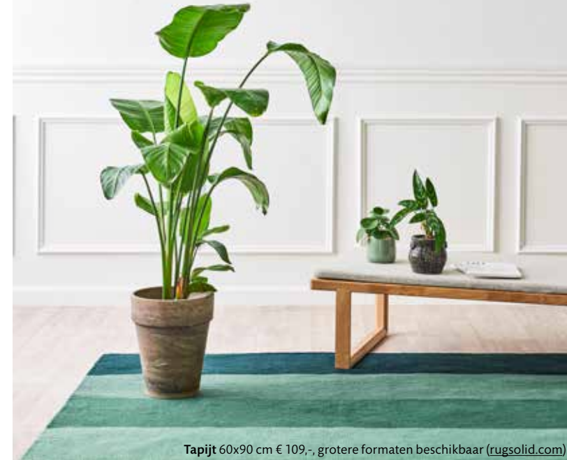
Tapijt 60x90 cm € 109,-, grotere formaten beschikbaar ( rugsolid.com )

Ontworpen in Denemarken, gemaakt in India: dit zachte tapijt in vier groentinten van Rug Solid. Als ze zouden zeggen dat het is gemaakt van wol zou je het zo geloven, maar niets is minder waar: er zijn toch echt petflessen in verwerkt. Het tapijt is eenvoudig schoon te maken en is zowel binnen als buiten te gebruiken.