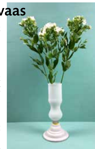
Vaas € 29,50 ( studiodewinkel.nl )